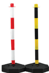
2 สีให้เลือก