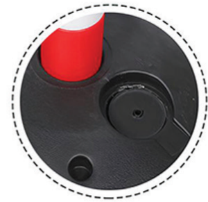
ช่องใส่น้ำหรือทราย