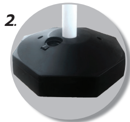
2. สามารถใส่น้ำหรือทราย เพื่อเพิ่มน้ำหนักสำหรับฐาน