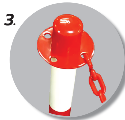
3. ด้านบน มีที่เกี่ยวโซ่ 4 รู