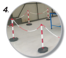
4. นิยมใช้ สำหรับแบ่งพื้นที่ทำงาน, ทางเดิน เพื่อความปลอดภัย