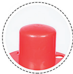
รูเกี่ยวโซ่